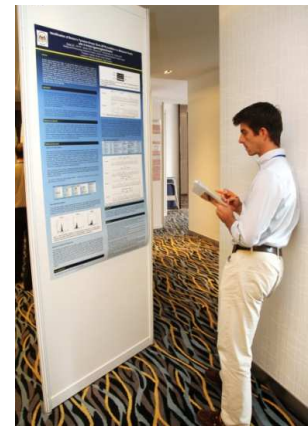
Pameran poster PGPM

Pada akhir Persidangan, cadangan-cadangan yang dikemukakan semasa Persidangan telah dipersembahkan secara ringkas kepada peserta-peserta.