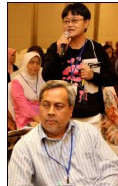
Seorang peserta mengemukakan soalnya dalam sesi soal jawab