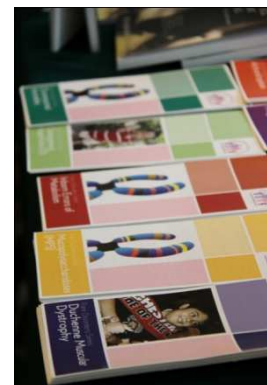
Risalah PPJJM di gerai PPJJM