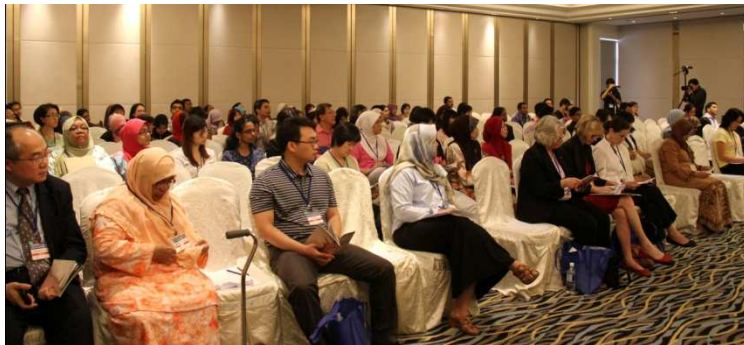
Para hadirin di Persidangan

Pada akhir Persidangan, cadangan-cadangan yang dikemukakan semasa Persidangan telah dipersembahkan secara ringkas kepada peserta-peserta.