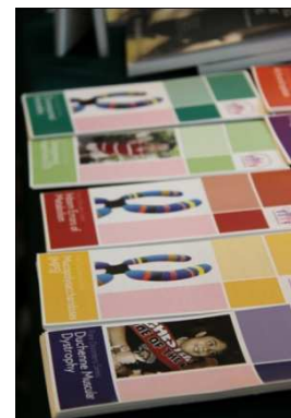
Risalah PPJJM di gerai PPJJM