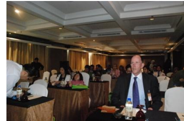
Para peserta di Persidangan Penyakit Jarang Jumpa Malaysia kali Kedua.