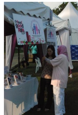
Gerai PPJMM di Larian Amal 'Feel Good Run 2013' anjuran ntv7.