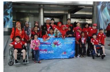
Lawatan ke Petrosains, KLCC.