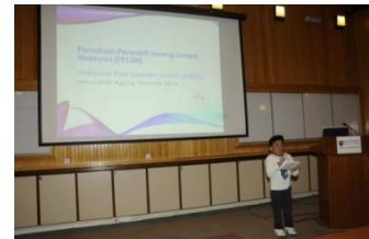
Mesyuarat Agung Tahunan PPJMM 2013.